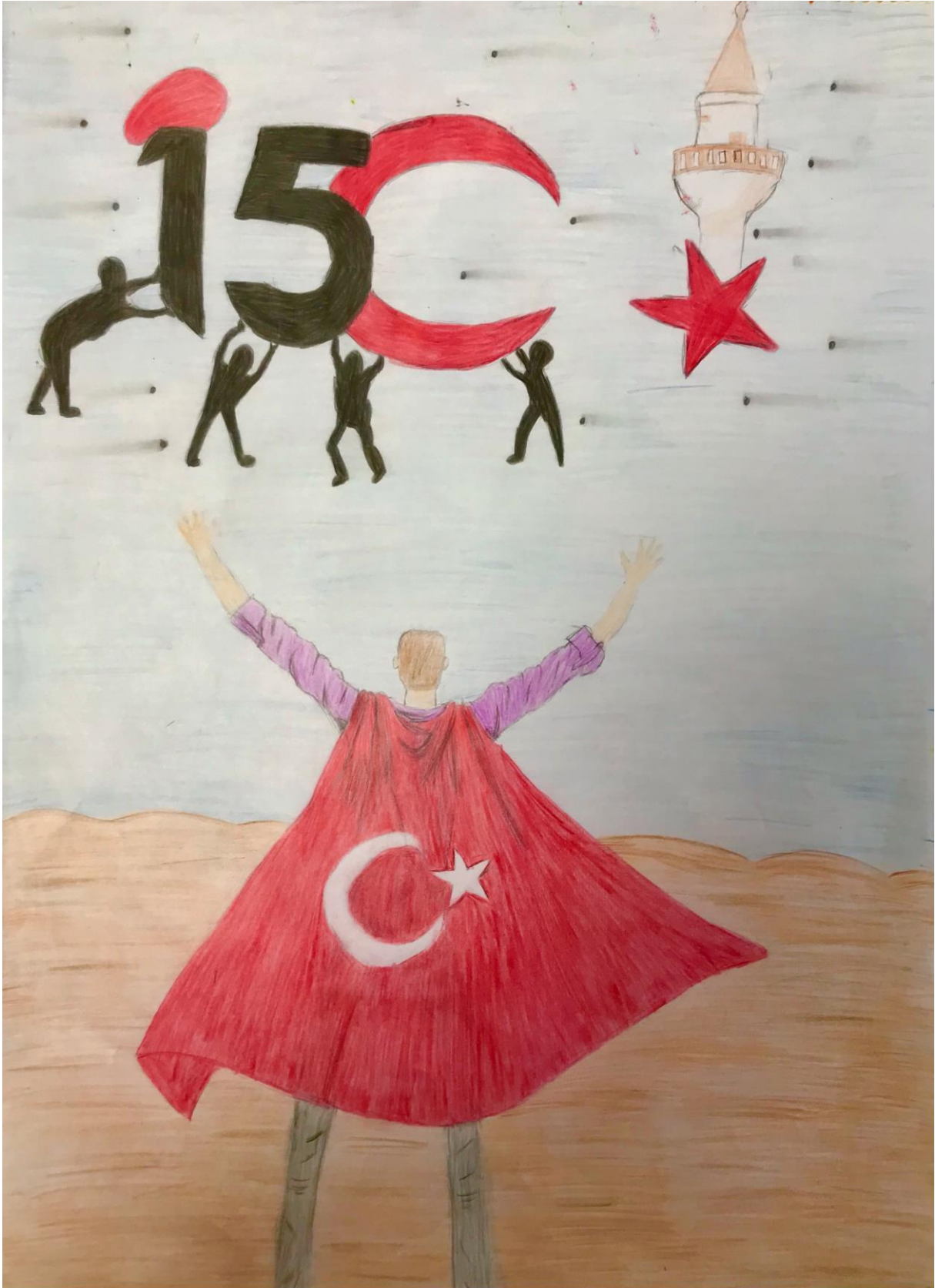
Merve TOY -7/A