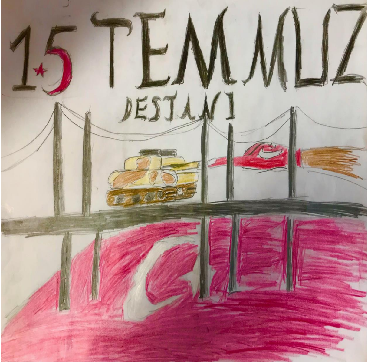
Nurettin AKTAŞ - 7/A