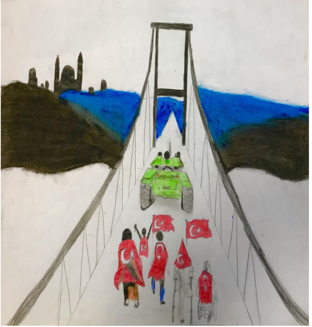
Fatmanur GÜLTEKİN 7/A